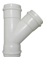
RAMAL INY 110X110 UD CLOACAL