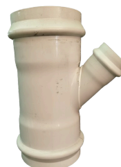
RAMAL REDUC TERMOFORMADO CLOACAL DN 110 a 630 mm