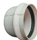
TAPON UD CLOACAL DN 110 a 630 mm