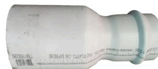
REDUCCION UD CLOACAL DN 110 a 630 mm