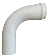
CURVA 90 UD CLOACAL DN 110 a 630 mm