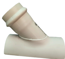
RAMAL POSTIZO UD CLOACAL DN 110 a 630 mm