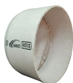
TAPON JP CLOACAL DN 110 a 630 mm