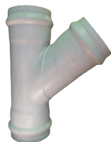
RAMAL TERMOFORMADO UD CLOACAL DN 110 a 630 mm