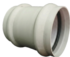
CUPLA UD CLOACAL DN 110 a 630 mm