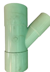
RAMAL INY 160X110 JP CLOACAL