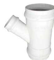
RAMAL INY 200X110 UD CLOACA